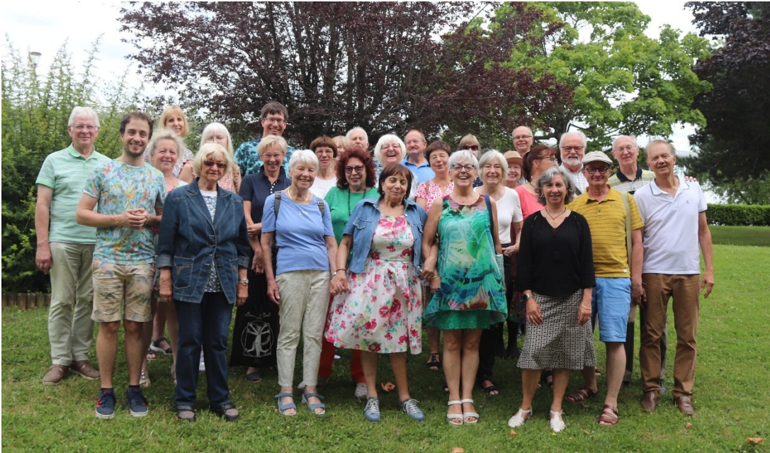
Université des Nations au lycée René Cassin