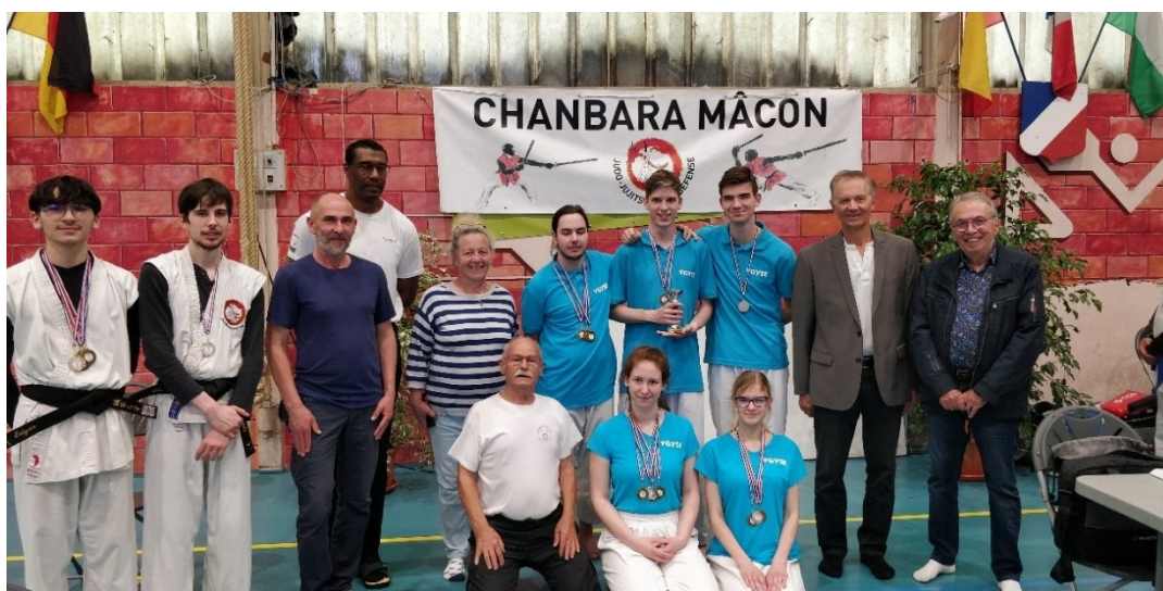
Equipe d'Eger invitée par le club Chanbara : remise des prix