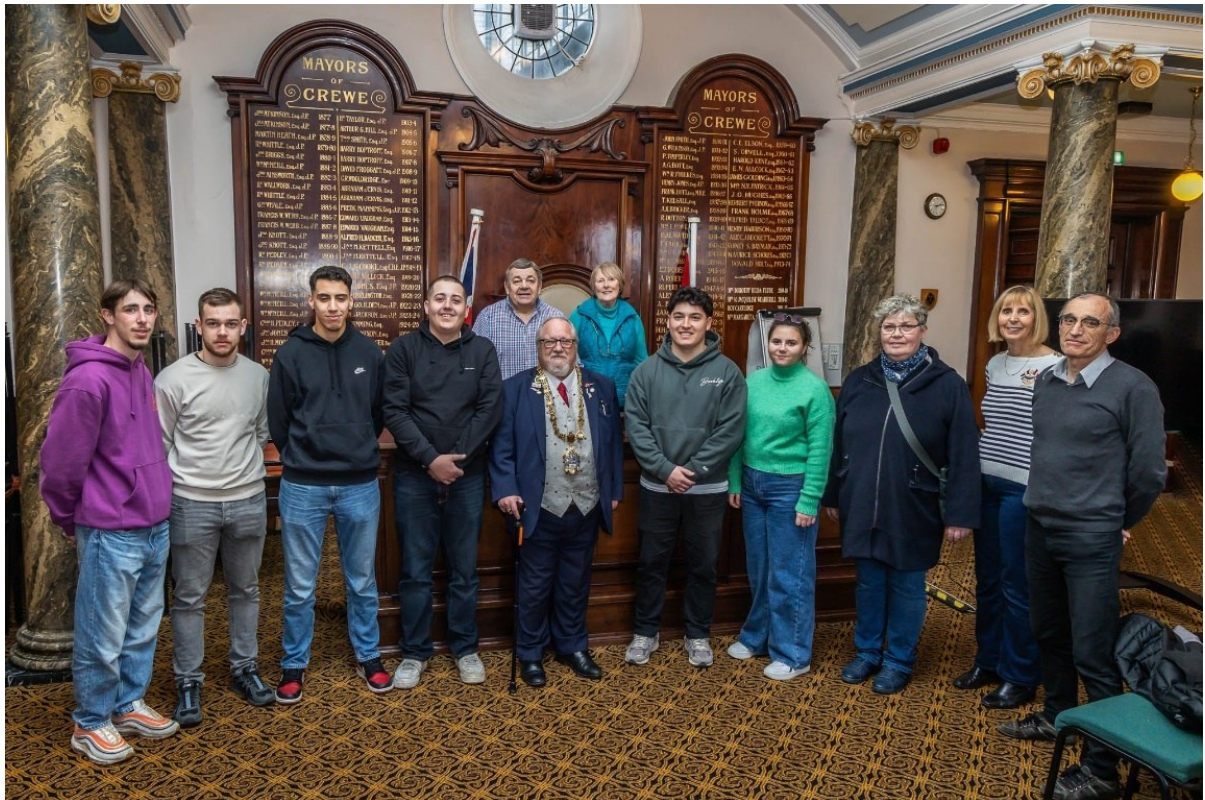
Accueil à la mairie de Crewe en présence du maire et du président du comité de jumelage de Crewe-Nantwich