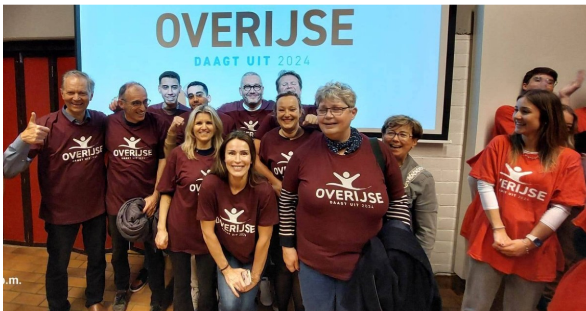
Equipe de Mâcon au défi lancé par Overijse