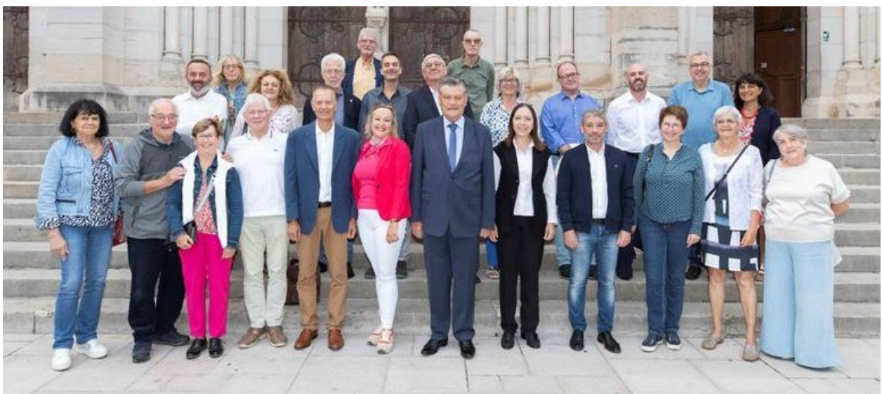
Accueil des délégations des villes jumelles par la municipalité