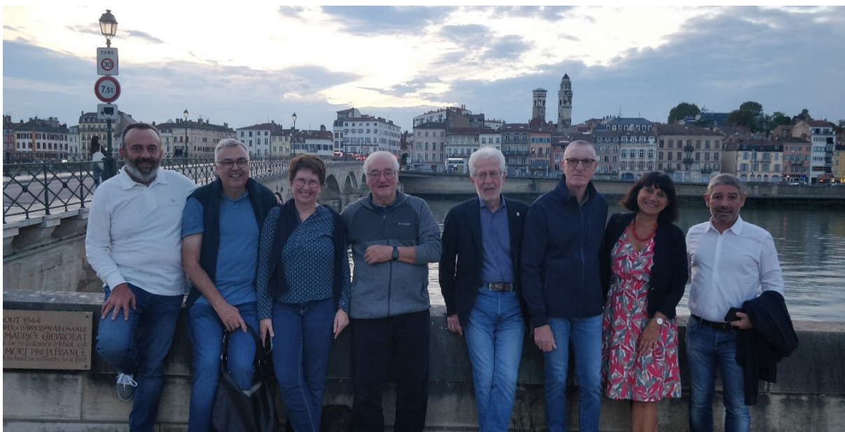
Les représentants de Neustadt, Santo Tirso et Lecco