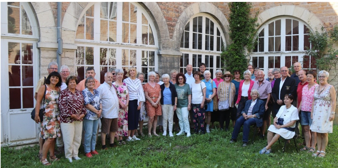
Rencontre avec les Mâconnais