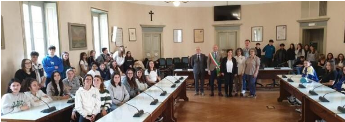
Les lycéens reçus à l'Hôtel de ville par le maire de Lecco Mauro Gattinoni