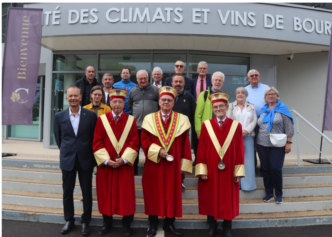
Accueil des délégations des villes jumelles par la Confrérie de Saint Vincent à la Cité des Climats et Vins de Bourgogne