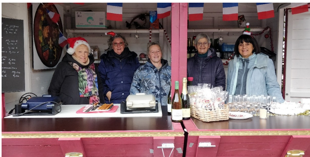
Les exposants mâconnais au Marché de Noël de Cunégonde (Kunigundenmarkt)