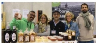
Les exposants sont heureux de faire découvrir leurs produits.